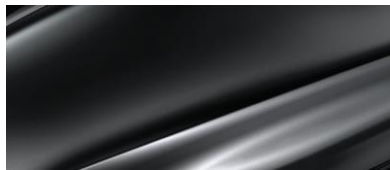
ТЕМНО-СЕРЫЙ МЕТАЛЛИК (MAGNETITE GRAY METALLIC)