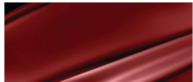
ТЕМНО-КРАСНЫЙ ПЕРЛАМУТР (CRIMSON RED PEARL)