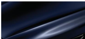
ТЕМНО-СИНИЙ ПЕРЛАМУТР (DARK BLUE PEARL)