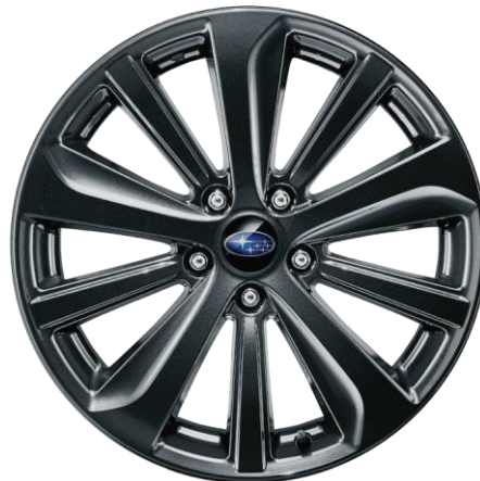
18" легкосплавные диски

* Цены указаны в случае покупки автомобиля с цветом кузова ЧЕРНЫЙ (CRYSTAL BLACK SILICA). За автомобили с цветом кузова ТЕМНО-СЕРЫЙ (MAGNETITE GRAY METALLIC) доплата за цвет составит 29 000 рублей, за автомобили с цветом кузова БЕЛЫЙ (CRYSTAL WHITE PEARL), ТЕМНО-СИНИЙ (DARK BLUE PEARL), ТЕМНО-КРАСНЫЙ (CRIMSON RED PEARL) доплата за цвет составит 39 000 рублей.