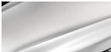
БЕЛЫЙ ПЕРЛАМУТР (CRYSTAL WHITE PEARL)